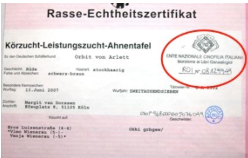
Figure 4. Nei pedigree stranieri, verificare registrazione al libro genealogico ENCI